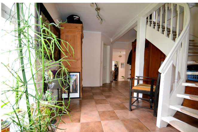
Diele/ Treppe z. DG